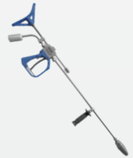
溢流枪配旋转喷头