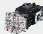
黄铜镀镍高压柱塞泵