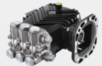
黄铜镀镍高压柱塞泵