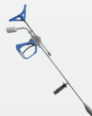
溢流枪配旋转喷头