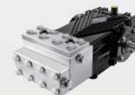
不锈钢高压柱塞泵