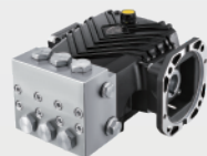
不锈钢高压柱塞泵