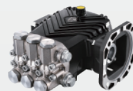
黄铜镀镍高压柱塞泵