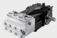
不锈钢高压柱塞泵