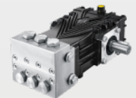
不锈钢高压柱塞泵