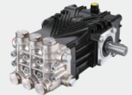
黄铜镀镍高压柱塞泵