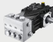
不锈钢高压柱塞泵