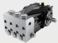
不锈钢高压柱塞泵