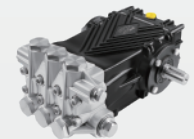
黄铜镀镍高压柱塞泵