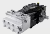
不锈钢高压柱塞泵