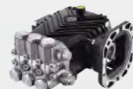
黄铜镀镍高压柱塞泵