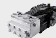
不锈钢高压柱塞泵