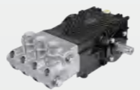
黄铜镀镍高压柱塞泵