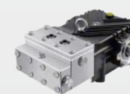
不锈钢高压柱塞泵