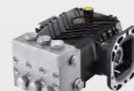
不锈钢高压柱塞泵