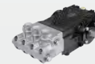
黄铜镀镍高压柱塞泵