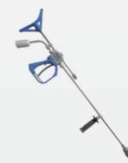
溢流枪配旋转喷头