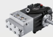
不锈钢高压柱塞泵