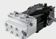
不锈钢高压柱塞泵